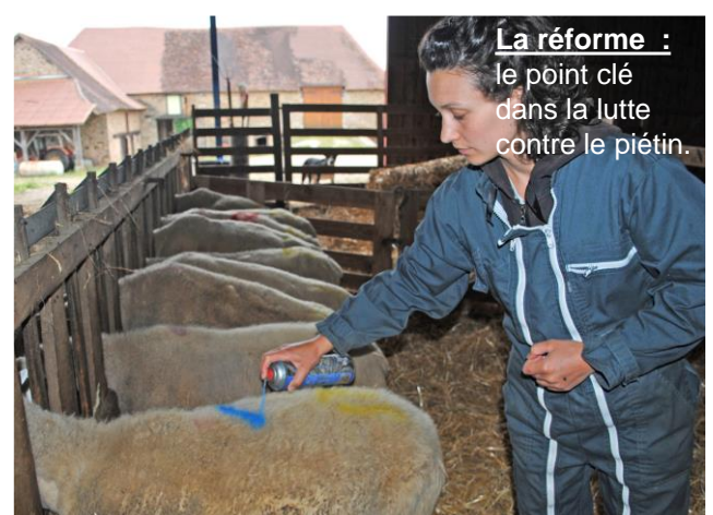
La réforme : le point clé dans la lutte contre le piétin.