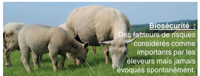
Biosécurité : Des facteurs de risques considérés comme importants par les éleveurs mais jamais évoqués spontanément.